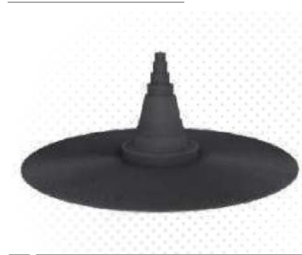
Abdichtmanschetten / Sealant collars