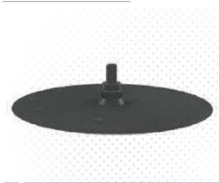
Abdichtmanschetten / Sealant collars