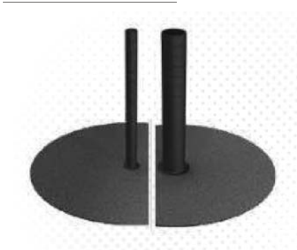
Abdichtmanschetten / Sealant collars