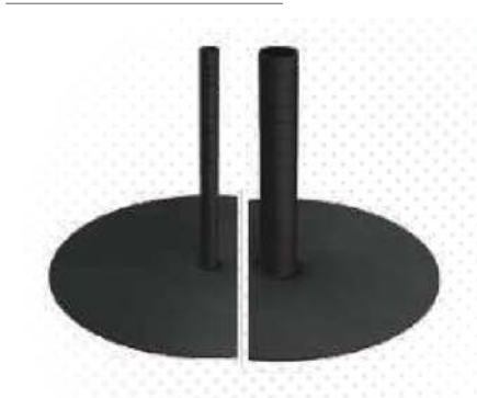
Abdichtmanschetten / Sealant collars