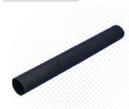
Abdichtmanschetten / Sealant collars